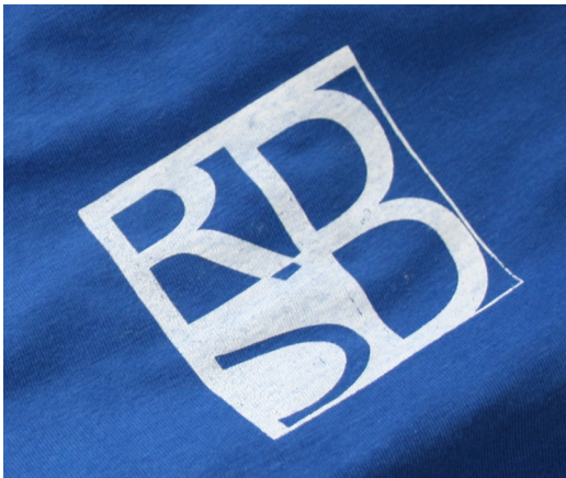
Klassisches RSB-Logo in weiß gedruckt wie bei Farbe 54 zu sehen

Wähle für T-Shirt und/oder Hoody folgende Bedruckung: